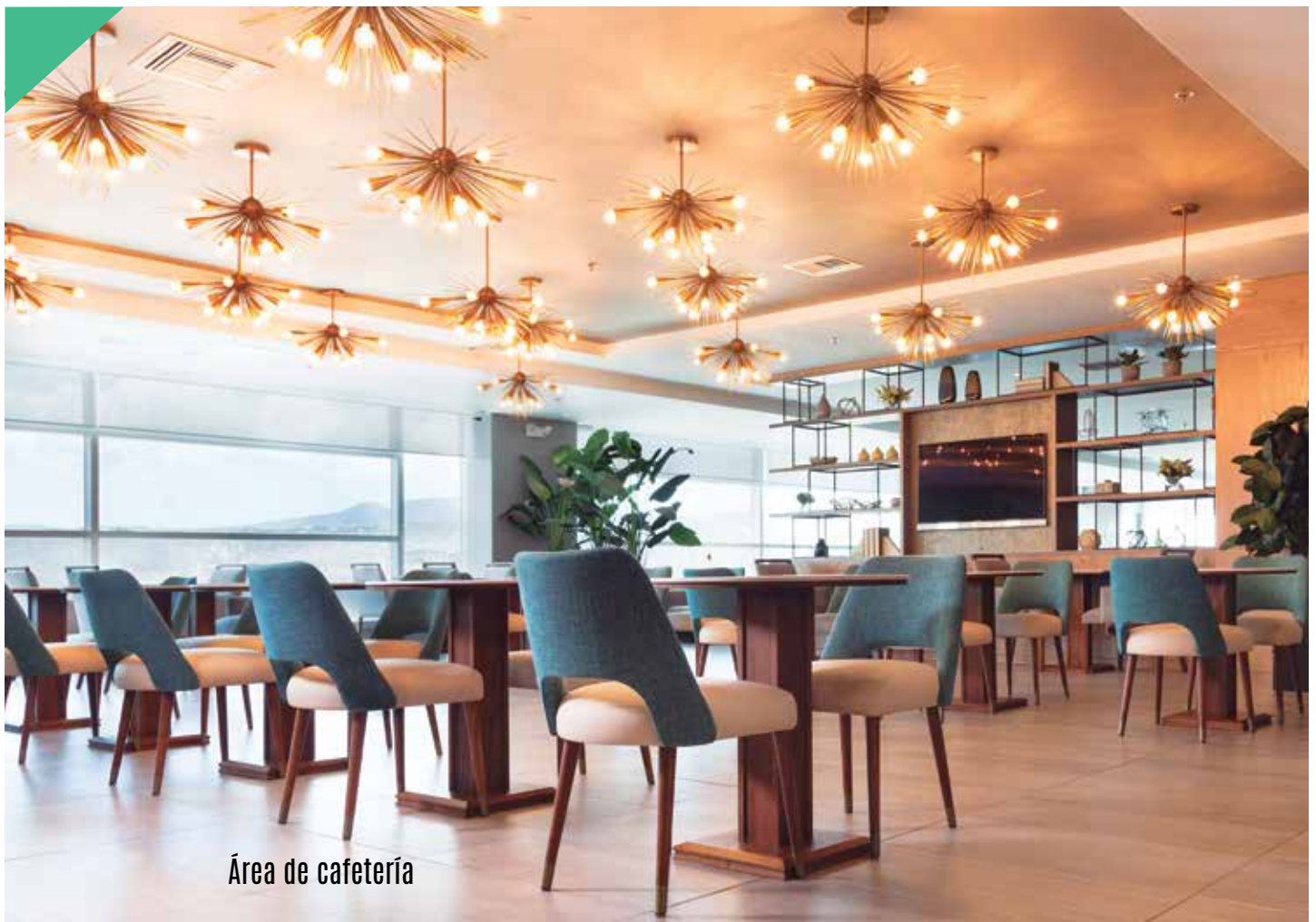
Área de cafetería

» avión y senderos en el cielo. El juego de materiales como el cuero, la pintura metalizada, el mármol y la iluminación tuvo como objetivo crear un ambiente de lujo.